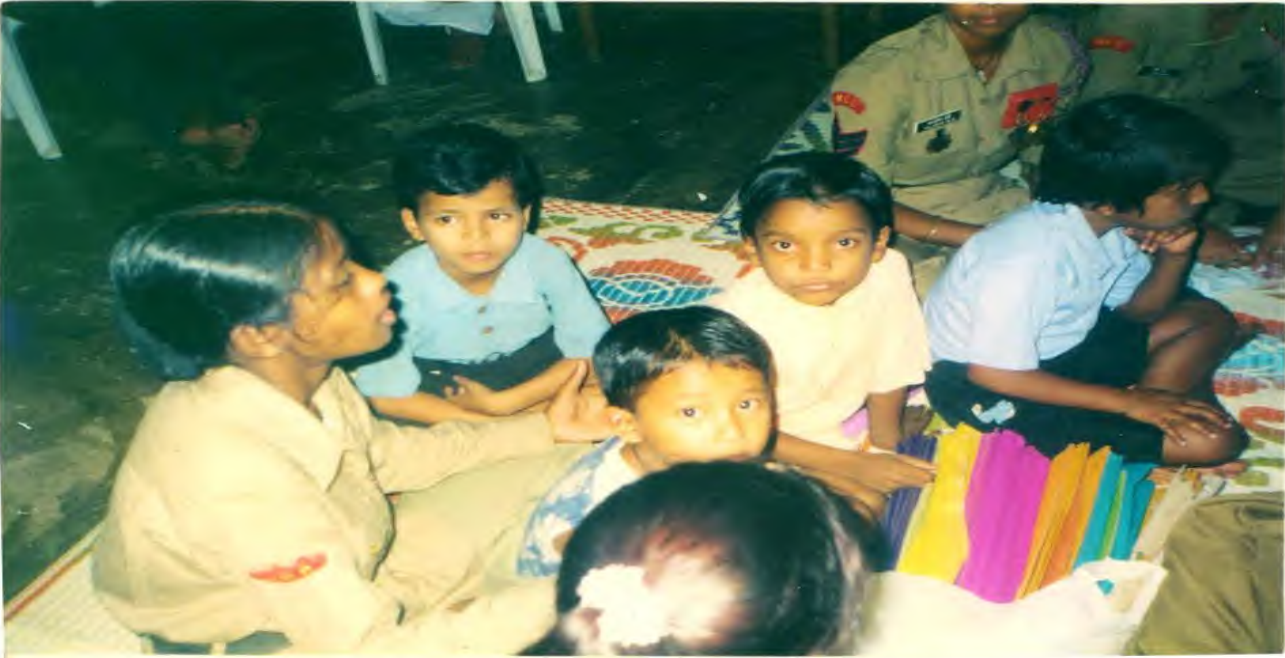
Workshop on hand made products, girls NCC wing of the college organised one-day workshop on making useful materials from waste in the "Anath-Ashram"-Dagaon on 14.09.2013.